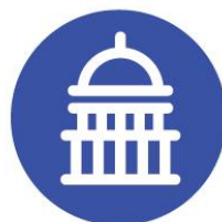
NUEVO ROL DEL ESTADO y SOCIEDAD