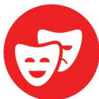
CULTURA y TURISMO