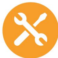
TRABAJO y PRODUCCIÓN