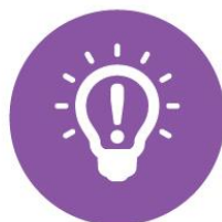
INNOVACIÓN y CREATIVIDAD