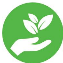
MEDIO AMBIENTE y ENERGÍAS SUSTENTABLES